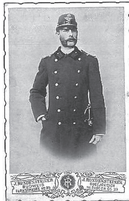
Austriacki urzędnik kolejowy

Z inicjatywy władz w Wiedniu instytucje te były tworzone i kolejno rozwijały się dzięki takim osobistościom jak książę Leon Sapieha - jeden z inicjatorów budowy, koncesjonariusz i prezes Towarzystwa Kolei Karola Ludwika i kolejno książę Adam Sapieha - jeden ze współzałożycieli Towarzystwa Akcyjnego Pierwszej Węgiersko - Galicyjskiej Kolei Żelaznej. Właścicielami linii były też Austriackie Koleje Państwowe. Do realizacji tych przedsięwzięć zatrudniono bardzo wielu