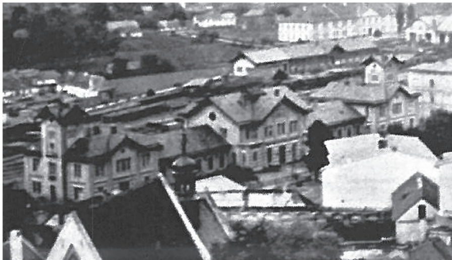
Pierwszy dworzec przemyski – fot. z ok. 1878 roku ze zbiorów Archiwum Państwowego w Przemyślu

Na jednym z arkuszy, specjalnie opisanym - „urzędnicy dróg żelaznych”, znajdujemy podpisy około 70 osób związanych zarówno z c. k. koleją Karola Ludwika, jak i c. k. I koleją Węgiersko - Galicyjską (ryc. 3). Po odczytaniu odręcznych, oryginalnych podpisów, na podstawie austriackiego rocznika urzędowego - Szematyzm Królestwa Galicji i